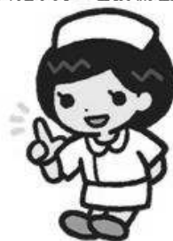
茨城県ナースセンターキャラクター はびなちゃん

土浦市下高津2-7-68 土浦訪問看護ステーション内 TEL:070-1543-9833 相談日:(火)(水)9:30~15:30