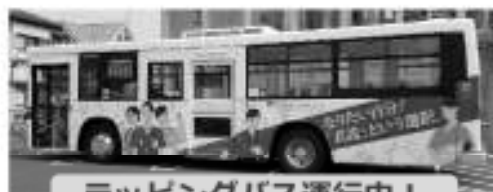
ラッピングバス運行中！

茨城県看護協会では、水戸市、土浦市、鹿嶋市に訪問看護ステーションを開設しております。