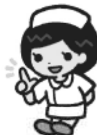
茨城県ナースセンターキャラクター はびなちゃん

茨城県ナースセンターホームページ https://www.ibaraki-nc.net/