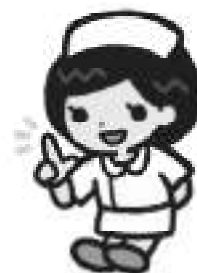
茨城県ナースセンターキャラクター はびなちゃん

土浦市下高津2-7-68 土浦訪問看護ステーション内 TEL：070-1543-9833 相談日：（火）（水）9:30～15:30